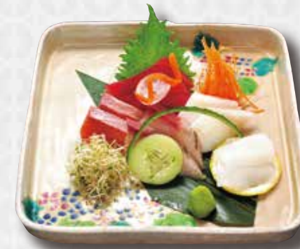
Sashimi 5 Kinds of Sashimi $25 刺身御膳