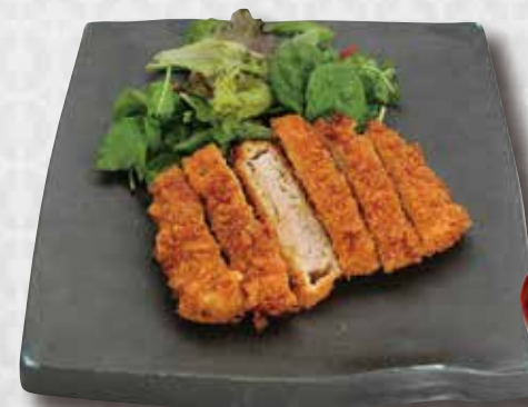
Chicken Katsu Bread Crumbed Chicken with Mixed Green $18 チキンかつ御膳