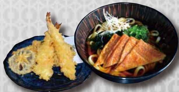
Tempura Udon or Soba Noodle in Soup with Fried Bean Curd and Tempura $22 天ぷらうどん 又は そば