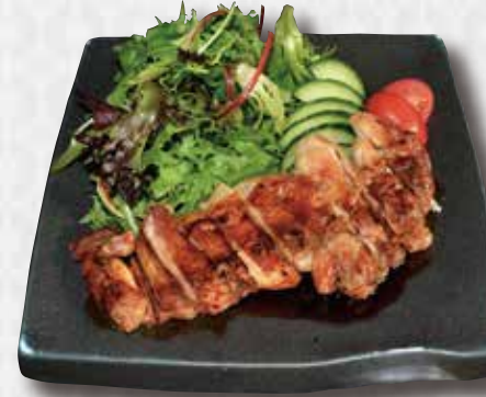
Teriyaki Chicken Grilled Chicken Thigh with Mixed Green $16 照焼きチキン御膳