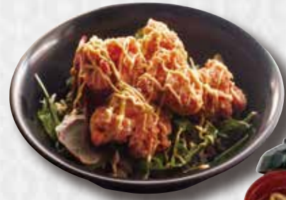
Deep Fried Kara-age Chicken Deep Fried Chicken Thigh on Rice $15 鶏唐揚げ丼