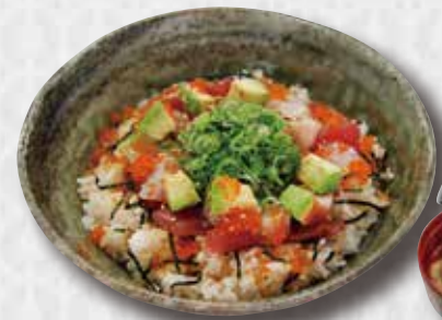
Seafood Poke Marinated Diced Sashimi, Avocado and Flying Fish Roe on Rice $20 海鮮ポキ丼