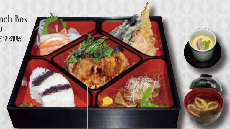
Lunch Box $40 松花堂御膳