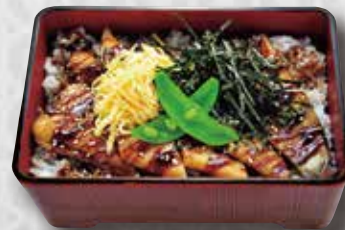
Grilled Conger Eel Grilled Conger Eel on Rice $28 焼き穴子丼