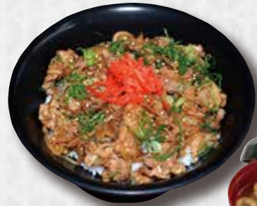
Simmered Wagyu Beef Sukiyaki Style Wgyu Beef on Rice $18 和牛丼