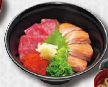
Fresh Tuna & Salmon Tuna and Salmon Sashimi, Spring Onion, Flying Fish Roe on Rice $22 鮪サーモン丼